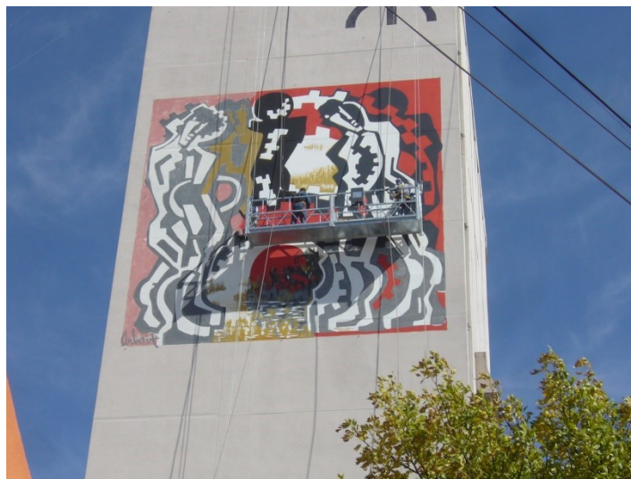
El mural durante la restauración. Puede observarse el andamio colgante semiautomático y a la izquierda el grado de deterioro que había alcanzado la pintura original.

Su realización material fue posible gracias al auspicio de las empresas: Dow Argentina, Consorcio de Gestión del Puerto de Bahía Blanca, Humberto Lucaioli S.A., Bahía Automotores S.A., OSDE, Land Plaza Hotel, Rex Comunicaciones Integradas, Bahía Coating, Grupo Bonacorsi, Profertil S.A., Oleaginosa Moreno Hnos. S.A.